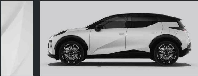
Crystal White | 707