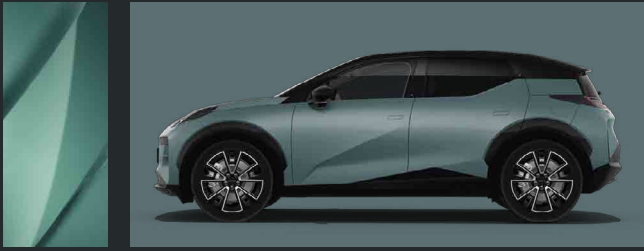
Green Pine | G01