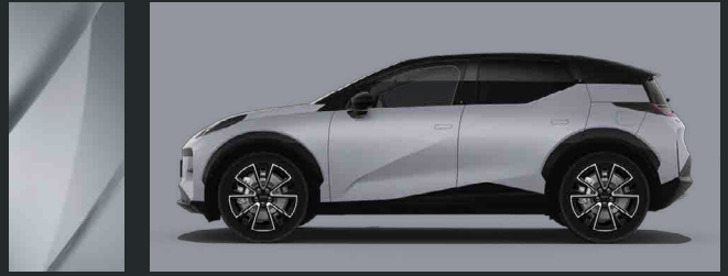
Grey Mist | C35